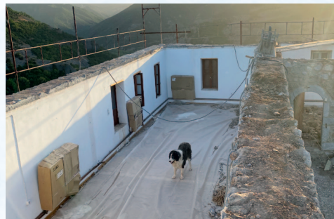
Έργα στη Μονή