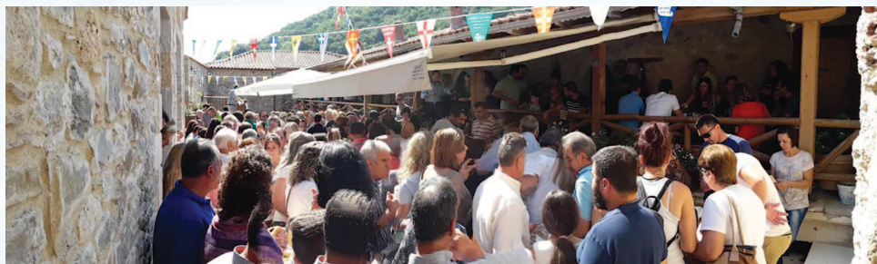
Το πανηγύρι της Μονής

Ένα θαύμα της Παναγίας που προστάτεψε το μοναστήρι της, αλλά και σύμφωνα με άλλη έκδοχή πήρε το όνομα Μακελλαριά, είναι και το κάτωθι: