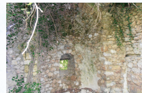
Ο έρειπωμένος Ναός Της Ευαγγελίστριας περιμένει την αναστήλωση