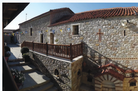
Ή έσωτερική αυλή

Στην έκθεση της Ί. Μονής μας μπορείτε να βρείτε: