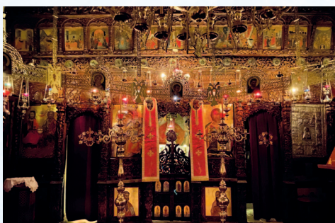
Το έσωτερικό του Καθολικού