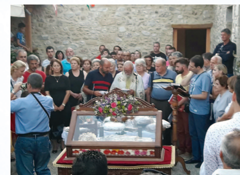
Άπο τον Έπιτάφιο της Παναγίας