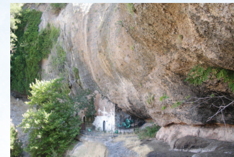
Το εκκλησάκι της Μεταμορφώσεως του Σωτήρος

Η Ίερά Μονή από την ίδρυσή της ήταν ανδρική αλλά τα τελευταία είκοσι χρόνια δεν είχε συνοδεία. Από τον Ίούλιο του 2011 με την εύλογια του Σεβασμιωτάτου Μητροπολίτη Καλαβρύτων και Αιγιαλείας κ.κ. Άμβροσιου ανέλαβε γυναικεία αδελφότητα ή οποία συνεχίζει το έργο της με την εύλογια του Σεβασμιωτάτου Μητροπολίτη Καλαβρύτων και Αιγιαλείας κ.κ. Ίερωνύμου.